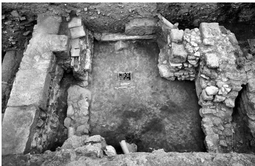
Рис. 4. Раскоп на южной стороне улицы Антигоны, секция Н. (Aravantinos [2016], 257. Еик. 4).