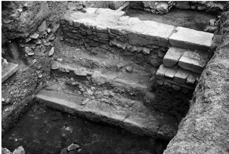
Рис. 5. Раскоп на южной стороне улицы Антигоны, секция К. ( Aravantinos [2016], 258. Еικ. 6).