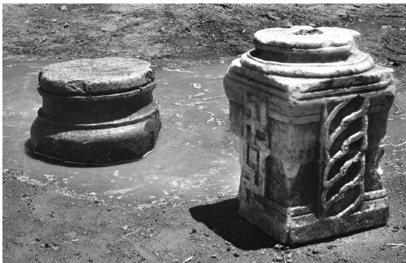
Рис. 3. Архитектурные детали раннехристианской базилики из раскопа на южной стороне улицы Антигоны (Aravantinos [2016], 257. Еик. 3).