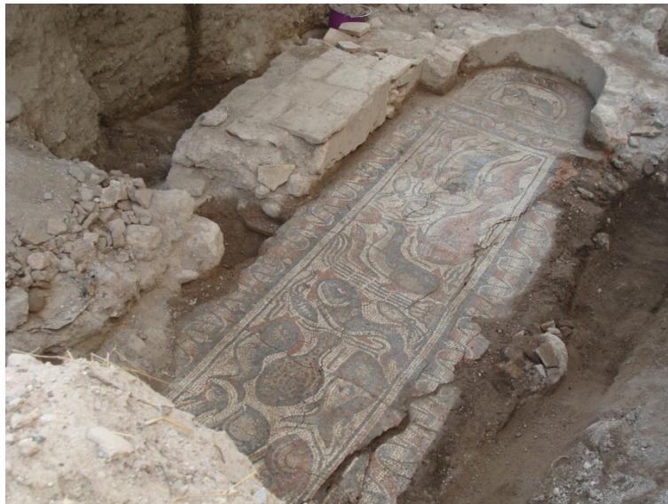
Рис. 6. Мозаичный пол фонтана из Фив (раскоп на южной стороне улицы Антигоны). Вид с северо-запада.