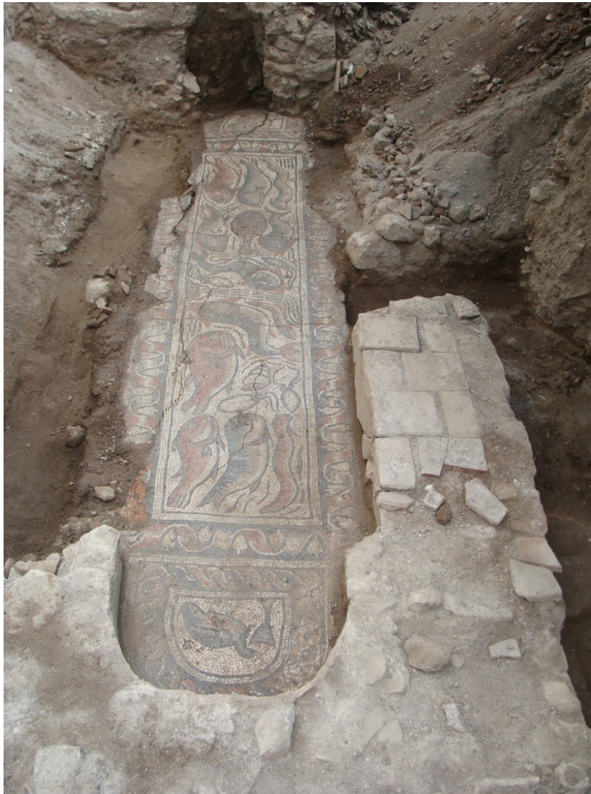
Рис. 7. Мозаичный пол фонтана из Фив (раскоп на южной стороне улицы Антигоны). Вид с юго-востока.