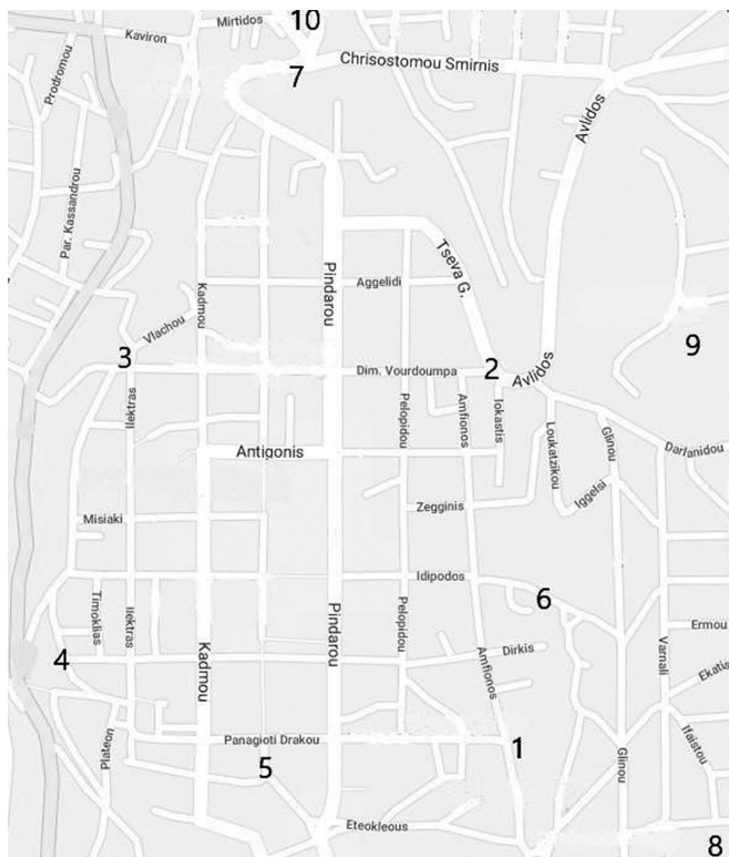
Рис. 1. Реконструкция местоположения ворот Фив и других монументов относительно современной карты

церковь Агиос Андреас, построенная в 1959 г 1 . Таким образом, в этой точке Павсаний заканчивает полный круг, возвращаясь опять к воротам Электры, где Керамопуллос раскопал ворота классического – ранне-эллинистического времени 2 . Это однозначно те ворота Элект-