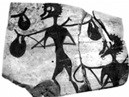
Рис. 3. Фрагменты кратера Позднеэлладского III Ц периода, найденного при раскопках 2014 г. под руководством Аравантиноса в Кадмее. Aravantinos V. Ἀνασκαφή μυκηναϊκοῦ ἀνακτόρου Θηβῶν // ΠΑΕ 2014. Athens, 2016. Fig. 5.

же Фивы? Имеются ли здесь фрагменты керамики с подобными сюжетами Позднеэлладского III Ц периода?