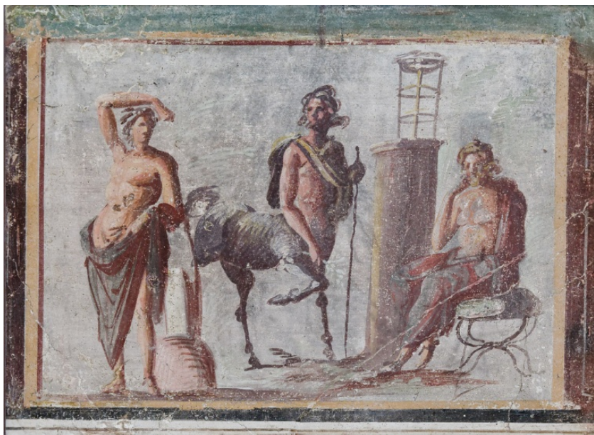
Илл. 3. Аполлон, Хирон и Асклепий 1 .

Дж. Грегори, делает вывод о том, что Асклепий является замечательным учеником Хирона, но, Ахиллес, все же, является самым одаренным учеником кентавра 2 . Без Хирона образовательный путь Ахиллеса был бы похож на пути других ахейских лидеров, от которых он был удален, «что вряд ли было бы подходящим для такого воина» 3 . Античные авторы подчеркивали, что именно Хирон научил Ахиллеса всему необычному 4 , а Феникс — обычным