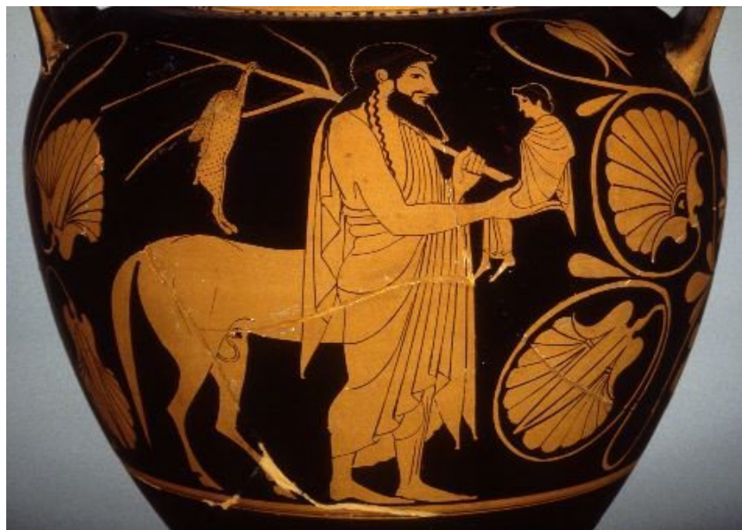
Илл. 4. Ахиллес, Хирон и заяц 1 .

В следующем мифоисторическом поколении после Ахиллеса Тидей разбивает череп защитника Фив Меланиппа и поедает его мозг (Стаций гротескно и подробно описывает это в «Фиваиде» Stat. Theb. VIII.751-66), что ужасает Афины. Вероятно, Хирон устраивает воспитание Ахиллеса, опираясь на древнюю педагогическую традицию, которая в глазах авторов позднего времени воспринималась как дикость. Детство Ахиллеса — это «переход от маленького дикаря, высасывающего животную жестокость из задыхающейся волчицы, к героическому ребенку, чью душу Хирон возвращает прославленной репутацией и в чьей груди отвага, чтобы никогда не подчиняться и не уступать» 2 . Ксенофонт отмечает,