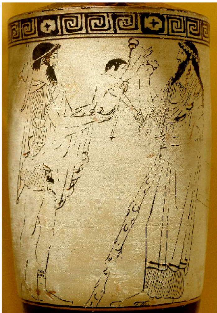
Илл. 1. Гермес передает Ахиллеса Хирону 1 .