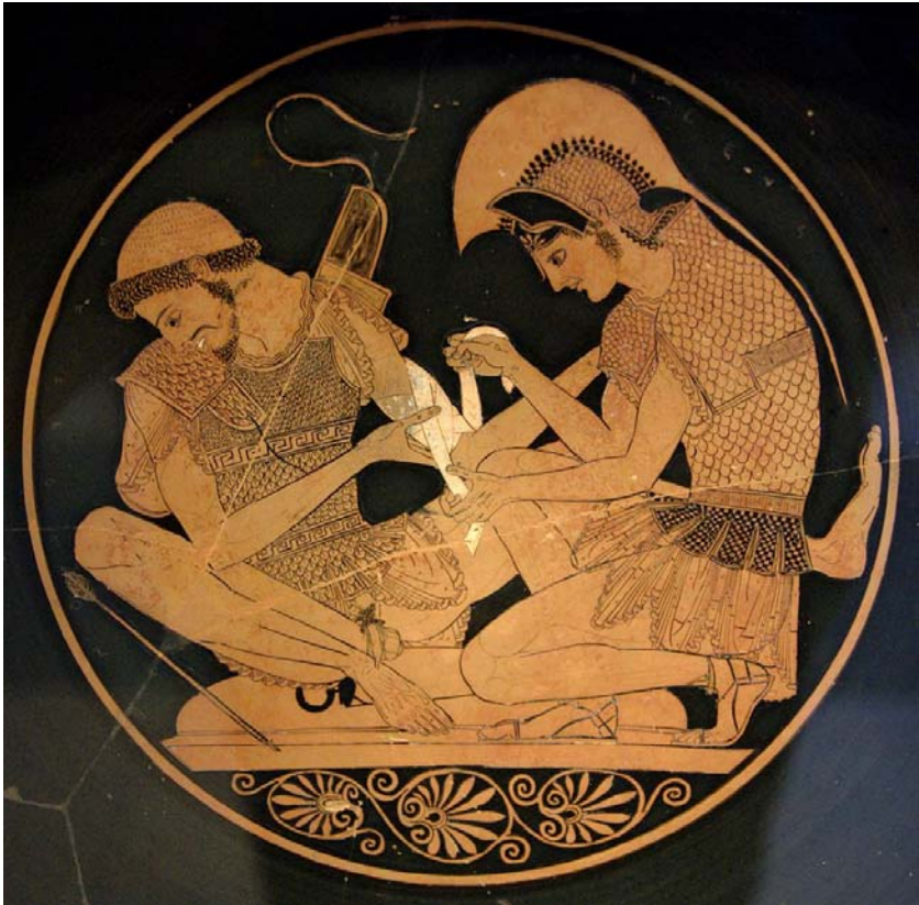
Илл. 5. Ахилл перевязывает руку Патрокла 1 .

Эврипил возлагает надежды на медицинские знания Патрокла, указывая на традицию передачи этих знаний от Хирона к Ахиллеса, а затем Патроклу. Такие надежды оказалось невозможным возложить на Геркала, выпустившего стрелу в Хирона и оказавшегося не